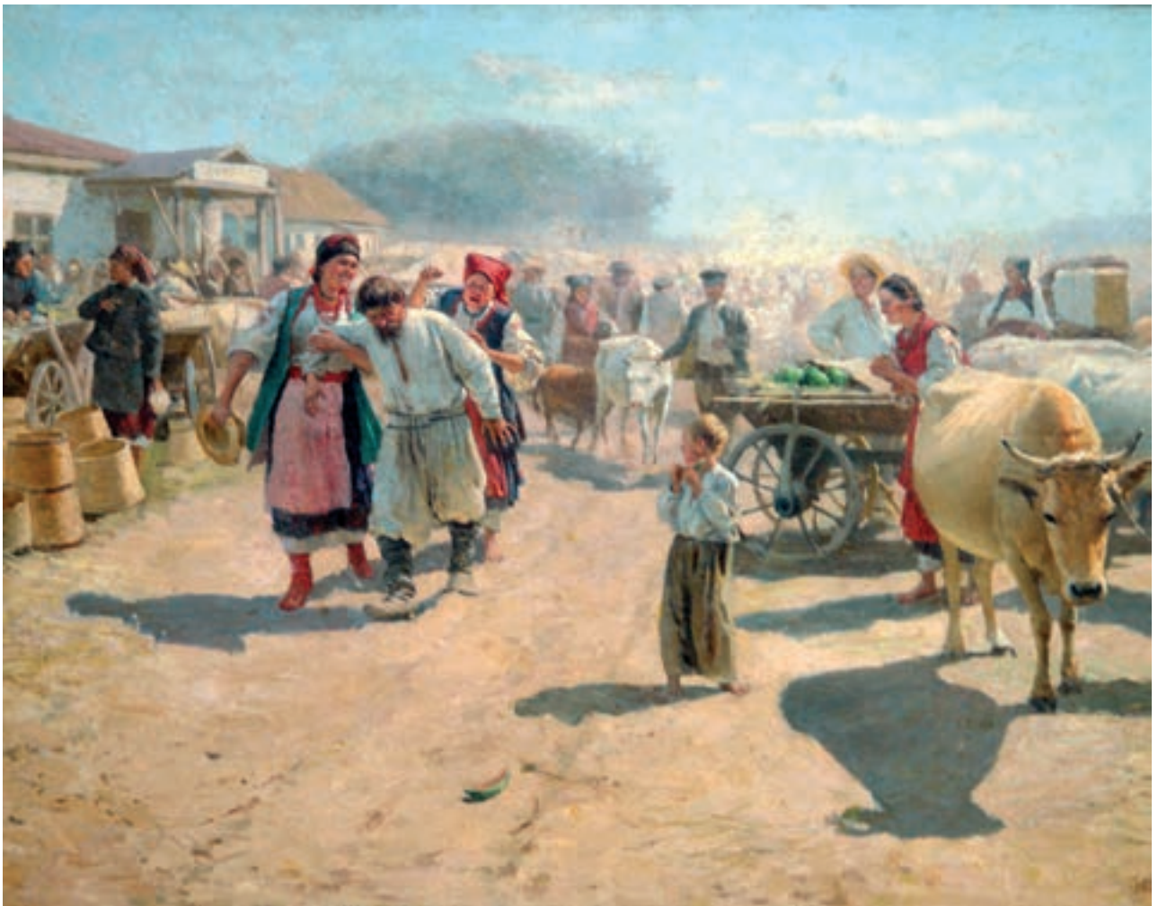
М. Пимоненко. «З базару»

Міграція — 1. Переселення народів усередині країни або за її межі; переміщення капіталу тощо: соціальна міграція, міграція населення, міграція грошей . 2. У біології — пересування