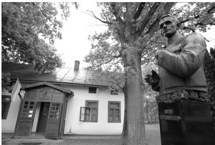
Хата родини Коновальців. Сучасний вигляд. Суспільне надбання