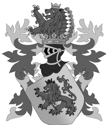
Герб Дому Габсбургів. Суспільне надбання

Вони народилися в Австро-Угорській імперії. Ця держава, (її також часто називають «Дунайською» або Австрійською імперією, Австро-Угорщиною / Die Österreichisch-Ungarische Monarchie) була приватною власністю однієї з наймогутніших європейських династій — Дому Габсбургів (Haus Habsburg). Представники Дому в XII-XIX століттях були Імператорами Священної Римської імперії, в різні роки та століття володіли Мексикою, Німеччиною, Іспанією, Португалією та інших сучасних європейських країн.