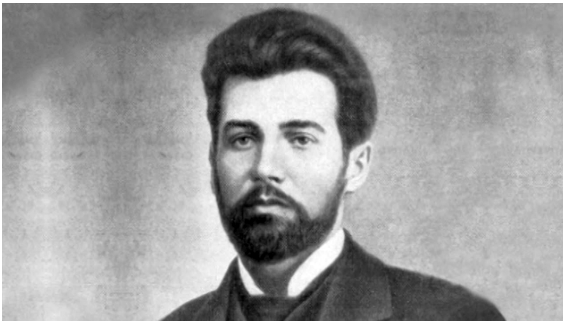
Василь Стефаник (1871—1936 рр.). Суспільне надбання