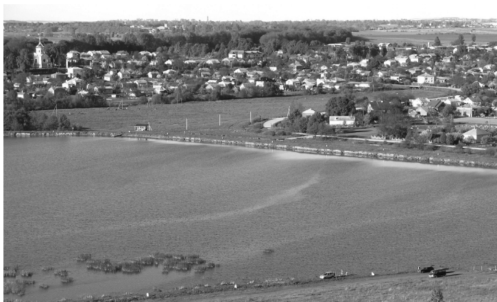
Панорама с. Зашків. Сучасний вигляд. Суспільне надбання