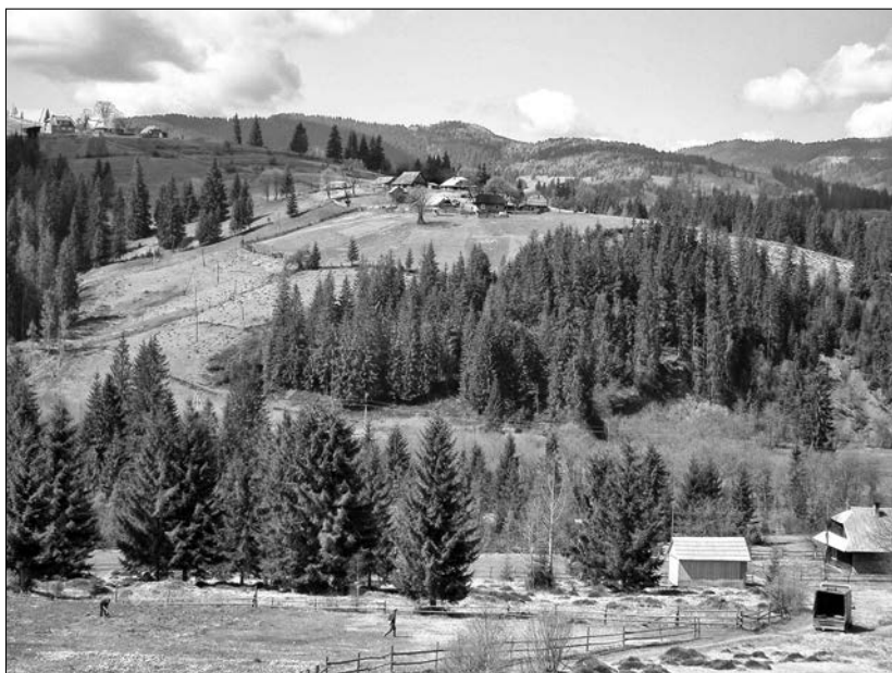
Фрагмент забудови с. Вишків Долинського р-ну Івано-Франківської обл.

На Бойківщині, де у XIX — на початку XX ст. переважало землеробство, найпоширенішими були поселення ланцюгової форми, які характерні для вузьких гірських долин. Земельні наділи мали тут вигляд довгих смуг, які