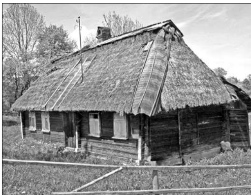
Хата початку XX ст. у с. Ілемня Рожнятівського р-ну Івано-Франківської обл.

гляді відомі тільки з кінця XIX — початку XX ст. [4, с. 47]. Іноді до причілка однієї з житлових камер добудовували комору: «хата» + «сіни» + «хата» + «комора». У с. Козева (Сколівського р-ну Львівської обл.) можна спостерігати процес тво-