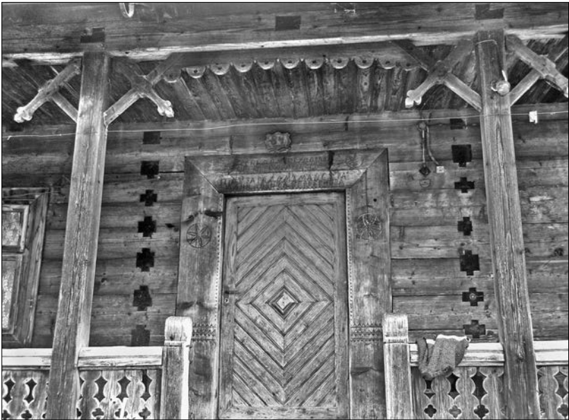
Фрагмент галерейки, с. Орявчик Сколівського р-ну Львівської обл.