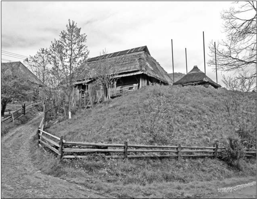
Двір вільної забудови, с. Липа Долинського р-ну Івано-Франківської обл.

«комора» + «боще» + «стайня» + «стаєнка на вівці» + «січкаря»; «комора» + «хижа»/«прибік» + «сіни» + «боще» + «стайня»/«половник» + «стайня» та ін. При фасадній стіні житлового зв'язку (хати, сіней та комори) зазвичай влаштовували дерев'яний поміст («лавки») чи галерейку («прісінок», «передвікна»). Вздовж тильної стіни споруди, під окопом даху розташовували «загати» («пелевники») — вузькі приміщення, призначені для зберігання сіна, соломи, сухого листу тощо. Часто «загату» споруджували ще при причілку стайні, а інколи вона охоплювала усю тильну і дві причілкові стіни будівлі. Траплялося так, що «загати» займали лише тильну стіну «боїща» та тильну і причілкову стіни «стайні», а при глухій стіні житлового приміщення прибудовували «прибік» («прибок») — переважно зрубне приміщення, яке виконувало функцію комори (у ньому зберігали картоплю, муку, бринзу тощо). У блоці «довгої хати» тік («боїще», «стодола») відігравав функцію не самостійного (в конструктивному відношенні) приміщення, а був ніби об'єднуючою ланкою між двома сусідніми зрубами: «хати» («сіней» чи «комори») і «стайні». Тильної стіни у «боїщі» іноді взагалі не було, тож з нього можна було потрапити безпосередньо в «загати». Фронтальний бік «боїща» часто висували дещо вперед (на ширину «лавки»). Цей винос у деяких насе-