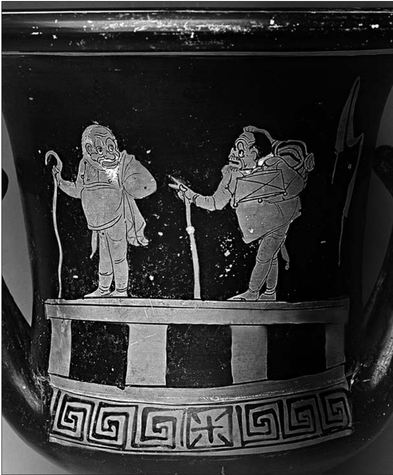
Господар та раб у дорозі. Сцена з комедії. 380—370 рр. до н. е.

вкрай потворним був раб Езоп, котрий був, однак, майстром мудрості.