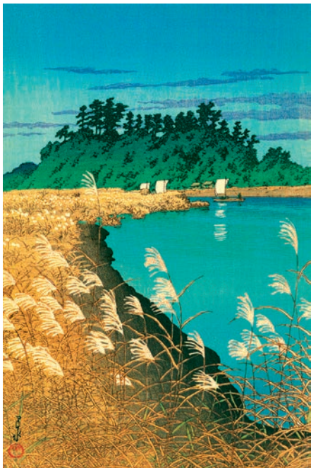
Кавасе Хасуї (1883–1957).