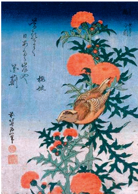
Кацүшіка Хокүсай (1760–1849).