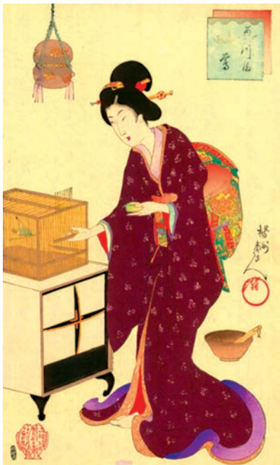
Тойохара Чіканобу (1838–1912).