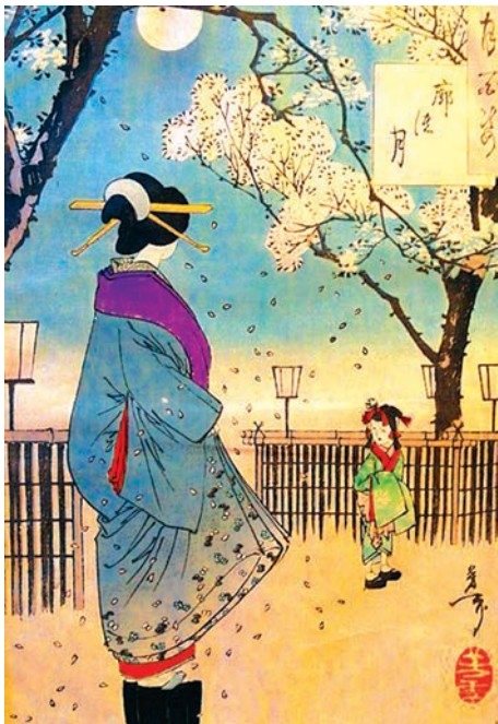
Цукиока Йошітоші (1839–1892).