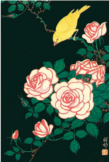
Охара Косон (1877–1945).