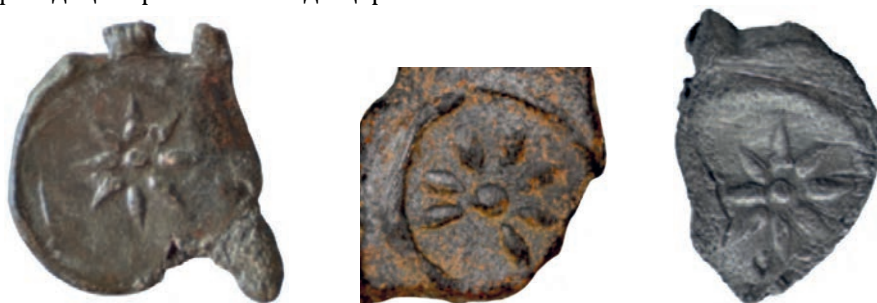
Іл. 5–7. Пломби з зображенням рози XIII ст.

Зображено розу й на інших тогочасних пам'ятках, зокрема на графіті та торговельних пломбах. Так, складну восьмипелюсткову квітку представлено на фасаді центральної апсиди церкви св. Пантелеймона в Галичі 35 .