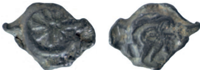
Іл. 8–9. Пломба з зображенням рози та лева XIII ст.

На пломбах дорогичинського типу XIII ст. роза фігурує в найрозмаїтіших видозмінах, найчастіше ж — із вісьмома загостреними пелюстками 36 . Іноді зображення рози поєднано з фігурою лева (геральдичним знаком Мономаховичів) 37 або галкою (гербом Галицької землі) 38 , що дозволяє атрибуувати ці пломби XIII ст. саме Романовичам.