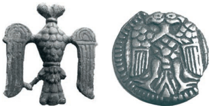
Іл. 12–13. Металеві підвіски з Галича зламу XII–XIII ст.

ження з донькою візантійського василевса 41 . Саме зломом XII–XIII ст., тобто часом його шлюбу з цісарівною та використання ним цісарської титулатури, датовано дві пам'ятки галицького походження із зображенням двоголового орла 42 . Першу з них — бронзову підвіску з деталізованим позначенням пір'я на фігурі птаха — знайдено поблизу церкви св. Пантелеймона в давньому Галичі (нині — с. Шевченкове Галицького району Івано-Франківської області). Другу пам'ятку — срібну підвіску — виявлено в околицях княжої столиці: круглий щит із кульковою облямівкою та двоголовим орлом, що його зображено в подібному стилі.