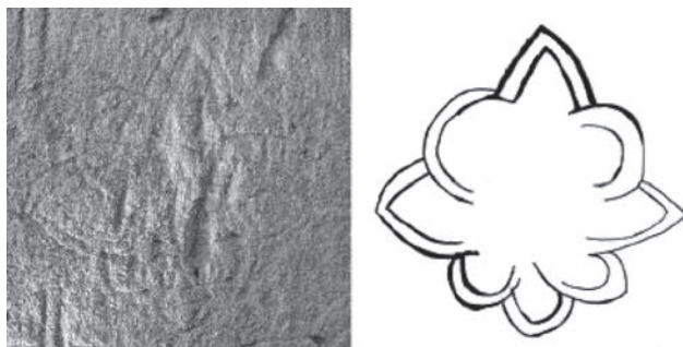
Іл. 3–4. Зображення рози на графіті з церкви св. Пантелеймона в Галичі першої половини XIII ст.

Натомість є відомості про ймовірне забарвлення герба племінника короля Данила — князя Волинського (1269–1288) Володимира Васильковича. Створений на початку 80-х рр. XIII ст. у скрипторії цього правителя 31 ілюмінований рукопис — Тверський Амартол (Троїцький список Хроніки Георгія Амартола) 32 , де викладено історію Стародавнього Сходу, античного світу та ранньої Візантії, містить численні мініатюри, на яких трапляються й щити з геральдичними сюжетами XIII ст. На мініатюрі «Здобуття Риму галами» (зворот арк. 25) представлено золотий щит із руським загальнодинастичним знаком — розою, що має чорний колір 33 . Зважаючи на практику барвного відмінювання цього герба в молодших відгалуженнях княжого роду 34 та місце створення самої пам'ятки, можна зі значною часткою вірогідності стверджувати, що на цій мініатюрі відтворено саме гербовий знак князя Володимира Васильковича.