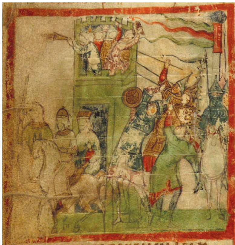
Іл. 2. Герб князя Володимира Васильковича на мініатюрі «Здобуття Риму галами» у Тверському Амартолі 80-х рр. XIII ст.

ходять від часів короля 27 Данила Романовича. Забарвлення цієї пам'ятки не має геральдичного характеру, оскільки кольори на плитках дібрано радше з суто декоративною метою. Серед старшої (королівської) лінії Мономаховичів уживано переважно червоно-золоте забарвлення загальнодинастичного герба, тож можна припустити, що й король Данило використовував герб із золотою розою на червоному полі, як і його дід — князь Переяславський (1146–1149, 1151–1154), Пересопницький (1155–1156), Волинський (1156–1170) і великий князь Київський (1167–1169, 1170) Мстислав Ізяславич 8 , а також прадід — князь Переяславський (1132–1133, 1142–1146), Волинський (1135–1142, 1149–1152) і великий князь Київський (1146–1149, 1150, 1151–1154) Ізяслав Мстиславич 29 . Батько Данила — князь Новгородський (1168–1170), Володимирський (1170–1187, 1188–1205), Галицький (1187–1188, 1199–1205), великий князь Київський, цісар і самодержець всієї Русі (1201–1205) Роман Мстиславич — також уживав на своїх печатках зображення щита з фігурою рози 30 , але щодо його забарвлення прямих свідчень немає.