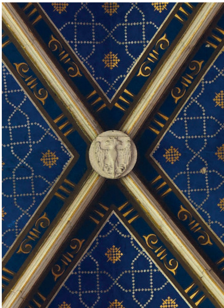
Іл. 14. Герб Перемишльської землі в катедральній базиліці в Судомирі 60-х рр. XIV ст.

Наявність останнього серед почту гербів Судомирської катедри дає підстави припустити, що фігура двоголового орла в той час навряд чи могла позначати цілу Руську землю, радше — якусь із її частин. Упродовж XV–XVI ст. двоголового орла вживано як територіальний знак різних теренів колишнього Руського королівства — Червоної Русі 48 , Перемишльської 49 та Сяноцької земель 50 , Луцького повіту Волинського воєводства 51 . Але найдавніше та найбільш стабільно цим гербом презентовано Перемишльську землю, тож найвірогідніше — саме з нею варто пов'язати судомирську пам'ятку 60-х рр. XIV ст.