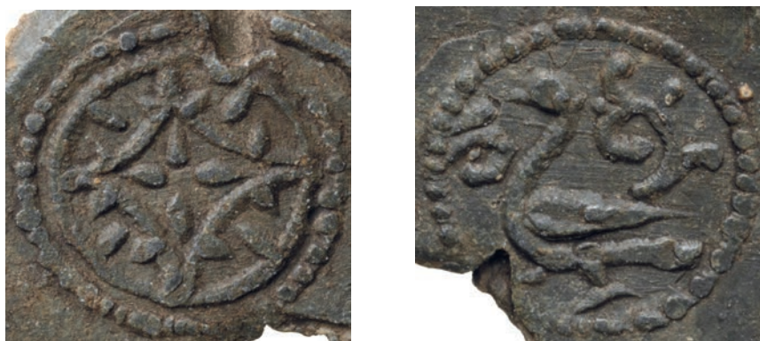
Іл. 10–11. Пломба з зображенням рози та галки XIII ст.

Ще один геральдичний знак Романовичів — двоголовий орел, — також мав давнішу історію в герботворенні правителів Русі. Запозичено цю фігуру з Імперії ромеїв, де вона відображала цілий комплекс ідей, пов'язаних з імператорською владою. У державних утвореннях, що перебували в орбіті Візантії, постійне чи спорадичне вживання цісарської титулатури 39 також поєднувало з візуальною презентацією ідеї Імперії за допомогою фігури імперського одноголового орла, згодом — двоголового. У Руській землі цей знак також відображав певний комплекс уявлень, передусім — здійснення «руськими цѣсарями» самодержавної влади на кшталт зверхників Нового Риму або династичної спорідненості з василевсами ромеїв.