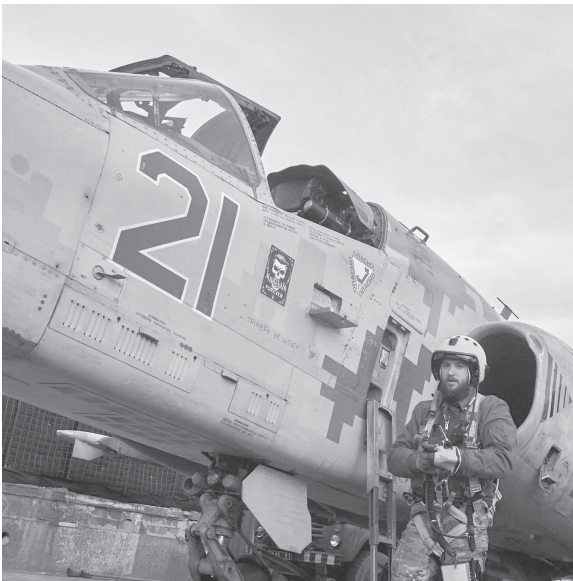
© Костянтин та Влада Ліберови, фото, 2024