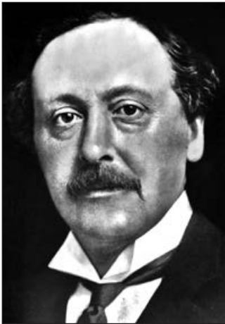
Герберт Джон Гладстон

панічно втік, а увінчав усе це мапою Британії з позначками місцезнаходження виявлених, за його словами, ворожих агентів. Насіння впало на благодатний ґрунт, підігрітий потоком листів з усіх кінців країни. У результаті шпигунська істерія дала свої плоди, оформлені зазначеним рішенням Комітету імперської оборони. Крім Бюро секретних служб, КІД створив підкомітет спостереження за ворожою діяльністю на території імперії. До цього вельми представницького органу увійшли: військовий міністр, керівник Директорату військових операцій, перший лорд Адміралтейства, генеральний директор поштового відомства, постійні заступники міністрів фінансів і закордонних справ, а також низка інших високих посадових осіб. Головував у ньому міністр внутрішніх справ Герберт Гладстон.