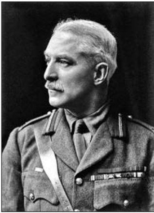
Джордж Кайнастон Кокерілл

новано на секцію МО-3, вона при цьому втратила дві підсекції, що займалися картографією. Утім, процес виведення картографів зі складу розвідки був характерний для армій усього світу, в яких раніше чи пізніше організовувались окремі картографічні служби. У складі МО-3 залишилися підсекція «особливих завдань» і бібліотека, якими керував майбутній директор військової розвідки Джордж Кокерілл.