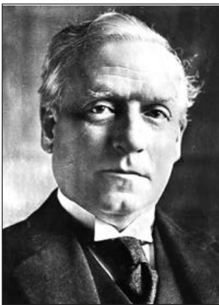
Герберт Генрі Асквіт

ся регулярними опитуваннями тих англійців, які здійснювали закордонні поїздки, найперше — бізнесменів. Не можна сказати, що у Форин-офісі не усвідомлювали вразливості й слабкості такої системи, але всі боязкі спроби в цьому напрямі блокувалися побоюванням упустити важливу інформацію в ході відволення сил на тривалий процес створення комплексної системи політичної та економічної розвідки. Брак коштів і кадрів змушував іноді йти на дивні для того часу компроміси й півзаходи. Наприклад, для виконання розвідувальних завдань допускалася навіть можливість найму іноземних приватних розшукових контор, хоча у відкритих джерелах відсутні згадки про те, чи було її втілено в життя. Проте минуло багато десятиліть, і практика роботи спецслужб через аутсорсингові можливості набуде поширення в усьому світі. І при цьому спричинить чимало провалів та скандалів. Українську негативну роль в організації політичної розвідки відіграли послы, які практично одностайно категорично відмовлялися зв'язуватися з «особливими операціями». Тому органи політичної розвідки на першій стадії існування були невід'ємним елементом військових структур, і на плечі армії лягло додаткове завдання реорганізації своєї секретної служби з метою забезпечення керівництва держави політичною та економічною розвідувальною інформацією.