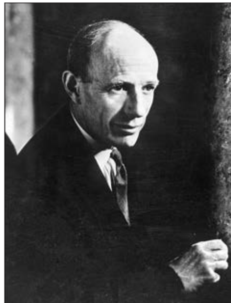
Едвард Фредерік Ліндлі Вуд, 1-й граф Галіфакс

У цей критичний час британський прем'єр переживав особисту трагедію краху створеної ним «мюнхенської» системи, і ця мала біда значною мірою заступила для нього велику біду всього народу. Навіть у промові з приводу початку війни в Європі він не забув поскаржитися: «Усе, заради чого я працював, усе, на